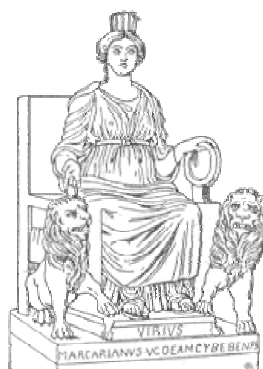
Rhéa, mère des dieux