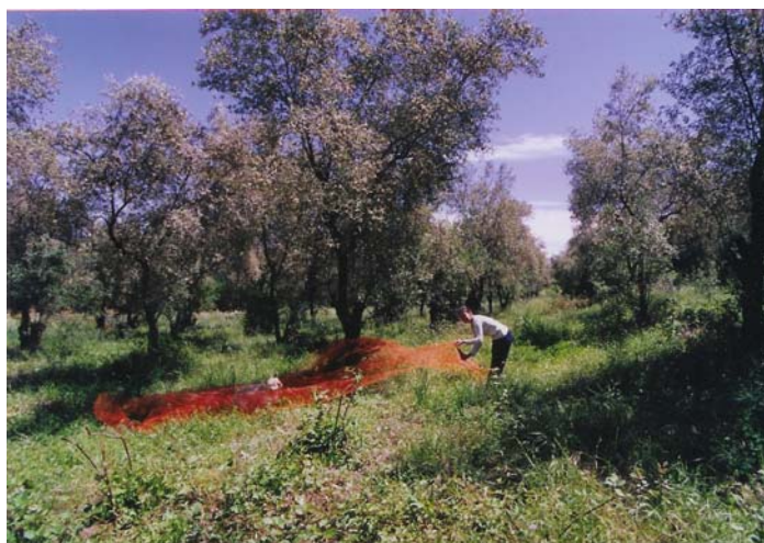
Muriel dans son champ d'oliviers à San Giuliano

Créer une ferme qui élabore pour vous en direct des cosmétiques d'une grande pureté végétale.